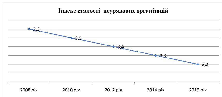
Рис.1. Індекс сталості неурядових організацій в Україні.