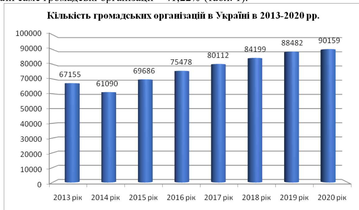
Рис. 2. Кількість громадських організацій в Україні в 2013-2020 рр.

Динаміка кількості інститутів громадського суспільства у вітчизняній управлінській системі демонструє зростання у 2020 р. кількості громадських організацій порівняно з попередніми роками, а саме: їх зареєстровано понад 90 тис., в 2019 р. – 88482, в 2018 р. – 84199, в 2017 р. – 80112, 2016 р. – 75478, 2015 р. – 69686 (рис.2). Станом на 1 червня 2020 р. у загальній кількості юридичних осіб за організаційно-правовими формами господарювання найбільшу питому вагу займали саме громадські організації – 41,22% (табл. 1).