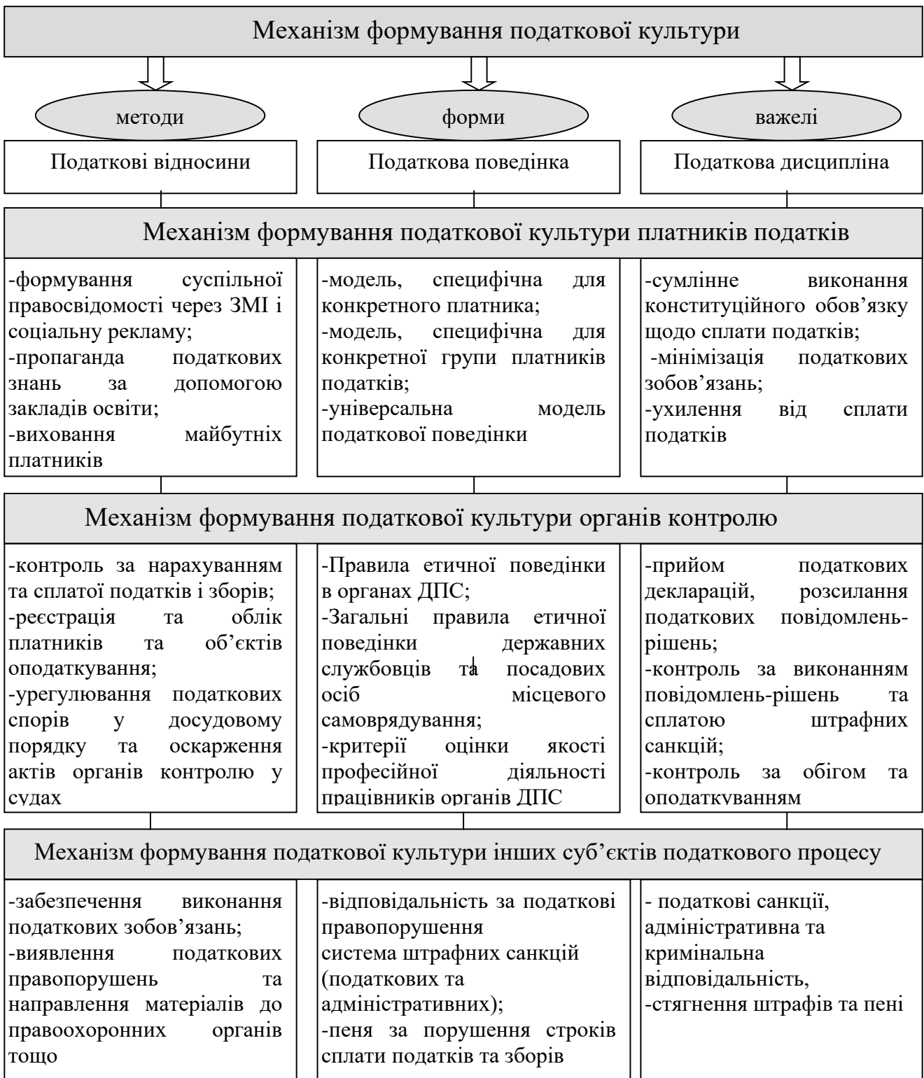
Рис. 1. Зміст і структура механізму формування податкової культури

допомогою яких забезпечується реалізація функцій податкової культури та її розвиток (рис.1).