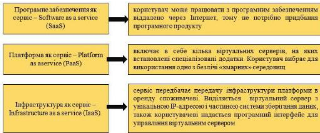
Рис. 1. Онлайн-платформи «хмарних» технологій.