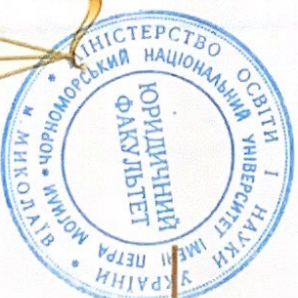
Т КЛАДЯ О.В.