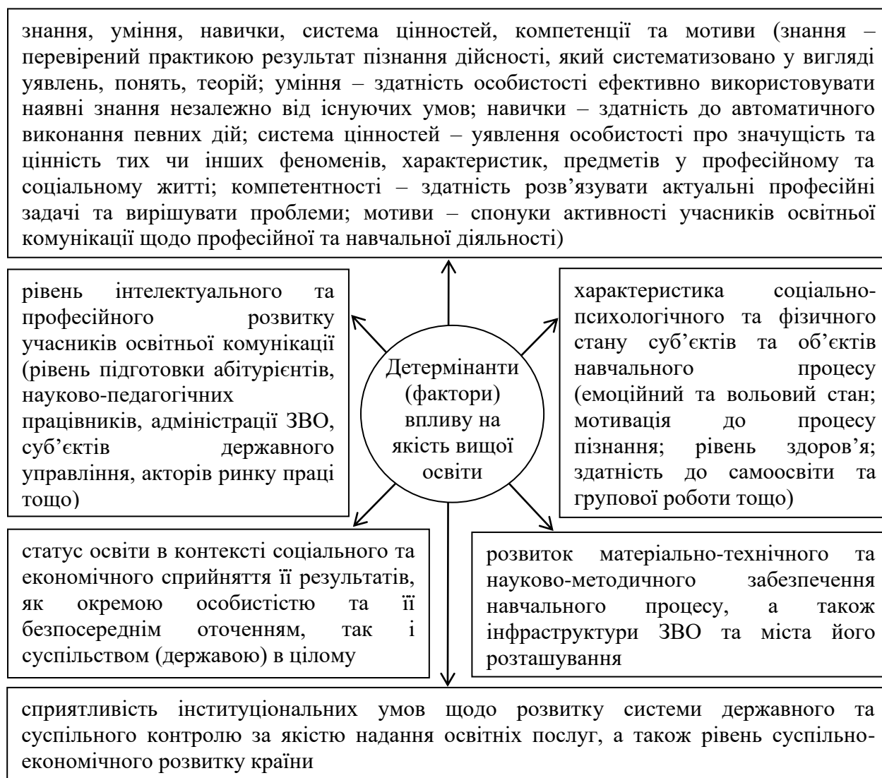
Рис. 2. Детермінанти (фактори) впливу на якість освіти

За результатами аналізу теоретико-методологічного підґрунтя для актуалізації змісту феномену якості вищої освіти були визначені ті з детермінант якості вищої освіти, вплив на які з боку суб'єктів публічного управління може забезпечити бажану за вектором та очікувану за змістом рефлексію об'єкту безпосередньої уваги. Основні з детермінантів впливу на якість вищої освіти подані на рисунку 2.