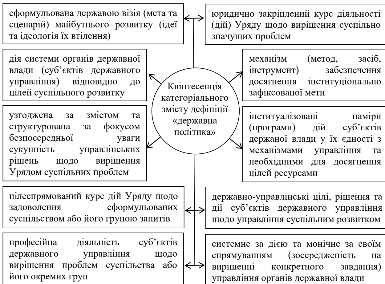
Рис. 5. Концептуалізація (узагальнення) змісту дефініції «державна політика»

педагогічних і наукових кадрів; порядок присудження наукових ступенів; порядок присвоєння вчених звань науковим і науково-педагогічним працівникам; порядок організації та проведення конкурсу на заміщення вакантних посад науково-педагогічних працівників; формулювання вимог щодо акредитації освітніх програм, за якими здійснюється підготовка здобувачів вищої освіти; обрання, призначення та звільнення з посади керівника закладу вищої освіти тощо.