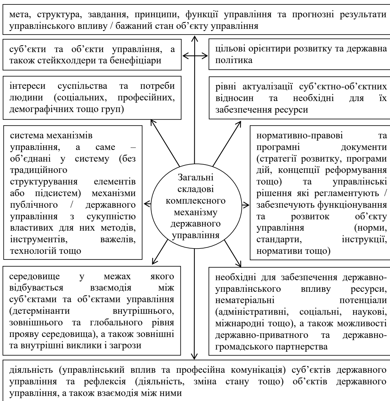
Рис. 4. Загальна (універсальна) структура комплексного механізму державного управління

функції управління та прогностні результати управлінського впливу; цільові орієнтири та державна політика у сфері вищої освіти; суб'єкти та об'єкти управління забезпеченням якості вищої освіти, а також основні стейкхолдери та бенефіціари; діалектично поєднані між собою (система) механізми публічного управління (сукупність методів, інструментів, важелів, технологій тощо які забезпечують рефлексію системи забезпечення якості вищої освіти у визначеному напрямі); нормативно-правові та програмні документи щодо функціонування та розвитку системи забезпечення якості вищої освіти; рівні актуалізації суб'єктно-об'єктних відносин у формуванні та реалізації державної політики у сфері забезпечення якості вищої освіти, а також необхідні для цього ресурси; безпосередня діяльність суб'єктів та об'єктів менеджменту якості вищої освіти, а також взаємодія між ними; середовище у межах якого відбувається взаємодія між суб'єктами та об'єктами управління забезпеченням якості вищої освіти, а також зовнішні та внутрішні виклики, загрози та ризики.