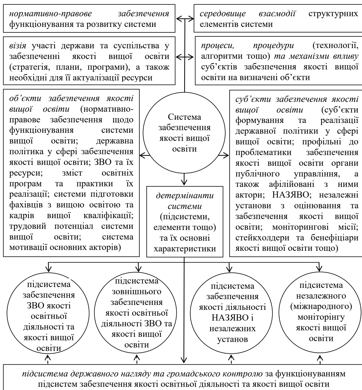
Рис. 3. Система забезпечення якості вищої освіти

Загальна (універсальна) структура комплексного механізму державного управління подана на рисунку 4. Запропонована структура комплексного механізму була покладена в основу розробки комплексного механізму публічного управління у сфері забезпечення якості вищої освіти. У самому спрощеному вигляді категоріальний зміст комплексного механізму публічного управління у сфері забезпечення якості вищої освіти може бути поданий через призму діалектичної єдності основних детермінант управлінської діяльності в системі менеджменту якості вищої освіти.