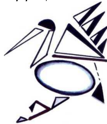
геометризація (чорно-біле зображення)