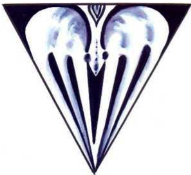
вписування в одну з геометричних форм зображення) (чорно-біле зображення)