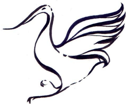
лінія (чорно-біле зображення)