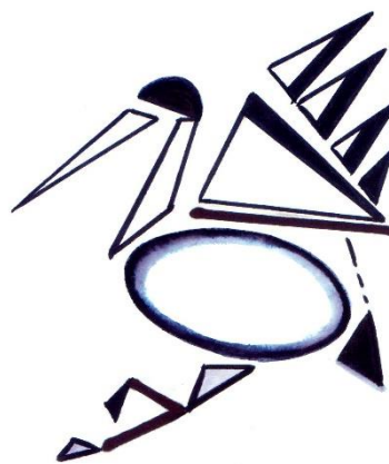
геометризація (чорно-біле зображення)