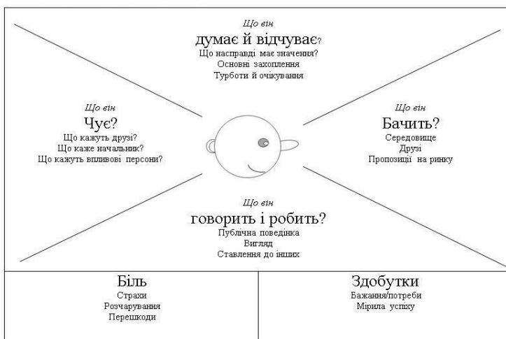
Рис. 4. Карта емпатії клієнта

Далі складається карта емпатії клієнта. Необхідно зобразити карту емпатії (рис. 4). Кожен сегмент карти заповнюється, відповідаючи на визначені питання. Перелік питань представлено у таблиці 6.