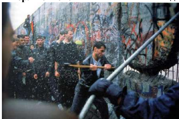
Фото: падіння Берлінської стіни

Саме цей день у подальшому і будуть вважати в усьому світі днем падіння Берлінської стіни – символом свободи та закінченням «Холодної війни».