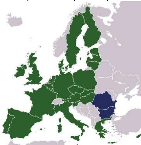
Фото: шосте розширення ЄС

У квітні 2005 року була підписана угода про вступ Болгарії та Румунії до ЄС. У ньому говорилося про те, що приєднання відбудеться тільки в тому випадку, якщо до 1 січня 2007 року країни виконають всі поставлені умови. Від Болгарії головним чином вимагали посилення законів по боротьбі з корупцією та злочинністю, поліпшення умов проживання в країні нацменшин і зростання економіки. Від Румунії – реформ освітньої та судової систем, вдосконалення соціальної політики щодо нацменшин і більше відповідального підходу до охорони навколишнього середовища. У разі невиконання цих умов Єврокомісія залишила за собою право відкласти вступ Румунії та Болгарії ще на рік. Договір про вступ Болгарії та Румунії до Євросоюзу з 1 січня 2007 року підписали в Ньюмюнстері в Люксембурзі. Під документами поставили підписи керівники Болгарії та Румунії, а також міністри закордонних справ 25 країн-членів ЄС.