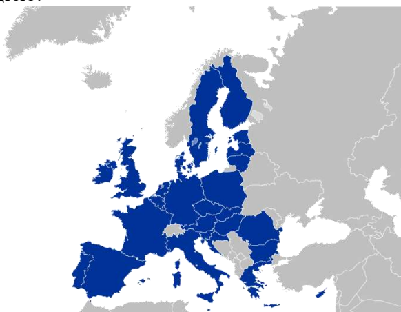
Фото: сьоме розширення ЄС

Такий вступ «авансом» для Хорватії вже був неможливий. Країни Євросоюзу дуже ретельно поставилися до контролю виконання Загребом (столиця Хорватії) всіх критеріїв вступу. Після прийняття Радою ЄС у грудні 2011 року рішення про приєднання Хорватії процес ратифікації відповідної угоди парламентами країн спільноти ставився у пряму залежність від виконання вимог європейських партнерів, насамперед у боротьбі з корупцією.