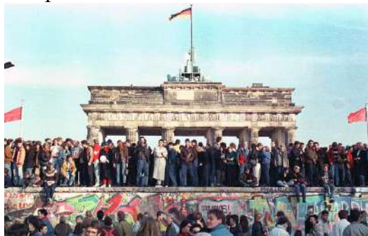
Фото: Берлінська стіна і Бранденбурзькі ворота

Гельмут Коль, канцлер ФРН, і Лотар де Мезьєр підписують договір про створення єдиного економічного простору. І в травні у м. Бонн починаються переговори за формулою «2 плюс 4» за участю обох німецьких держав і чотирьох держав-переможниць: СРСР, США, Франції та Великобританії.