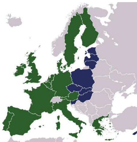
Фото: п'яте розширення ЄС

Громадська думка «старих» 15 держав-членів об'єднання змінювалася на більшу підтримку розширення ЄС у 2004 р. Так, наприклад, у 2000 р. 44% населення підтримувало розширення ЄС на Схід, а 35% були проти цього. Натомість через два роки, у 2002 р., вже 55% підтримувало вступ до ЄС нових держав з регіону ЦСЄ, а 37% виступали проти.