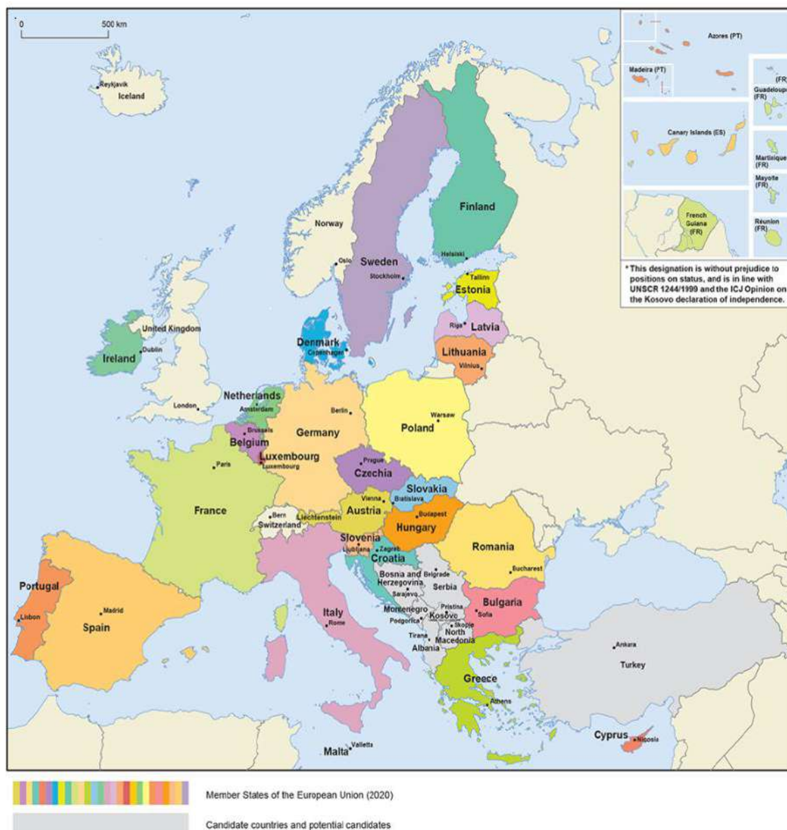
Фото: карта 27 країн-членів ЄС (станом на 2021 р.)

Таким чином, після виходу Сполученого Королівства Велика Британія та Північна Ірландія зі складу ЄС у січні 2020 р. (так званий Brexit), станом на 2021 р. ЄС складається з 27 країн-членів.