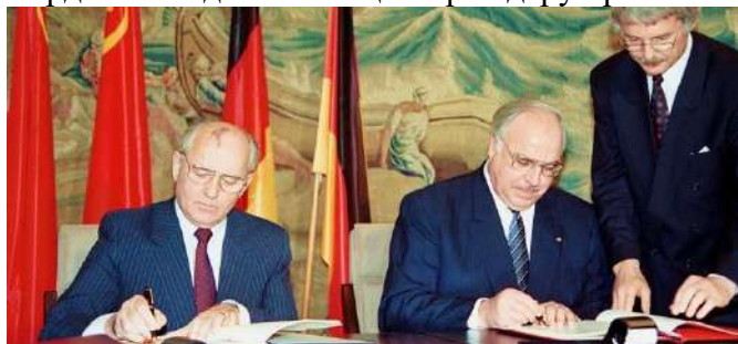
Фото: Михайло Горбачов, Генеральний секретар ЦК КПСС СРСР та Гельмут Коль, канцлер ФРН

На наступній зустрічі в Железноводську 16 липня 1990 Гельмут Коль, канцлер ФРН, і Михайло Горбачов, Генеральний секретар ЦК КПСС СРСР, домовляються з усіх спірних пунктів. М. Горбачов погоджується на входження об'єднаної Німеччини в НАТО. Визначається термін виведення радянських військ з території НДР. У свою чергу, уряд ФРН бере на себе зобов'язання в рамках економічної співпраці з Радянським Союзом. Німеччина визнає кордони західної Польщі по р. Одеру і р. Нейсі.