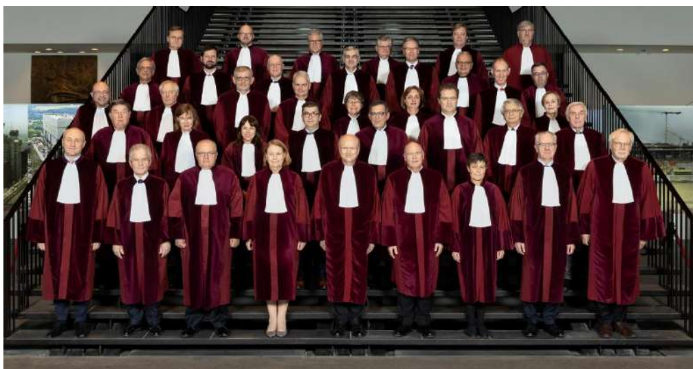
Суд (Court of Justice) 20.12.2019

Суд складається з 27 суддів та 11 генеральних адвокатів. Судді та генеральні адвокати призначаються за загальною згодою урядів держав-членів після консультацій з колегією, відповідальною за надання висновку щодо придатності кандидатів виконувати відповідні обов'язки. Вони призначаються на термін шести років, який може бути відновлений. Вони обираються з числа осіб, незалежність яких не викликає сумнівів, і які мають кваліфікацію, необхідну для призначення, у своїх відповідних країнах, належать до найвищих судових служб, або які мають визнану компетенцію.