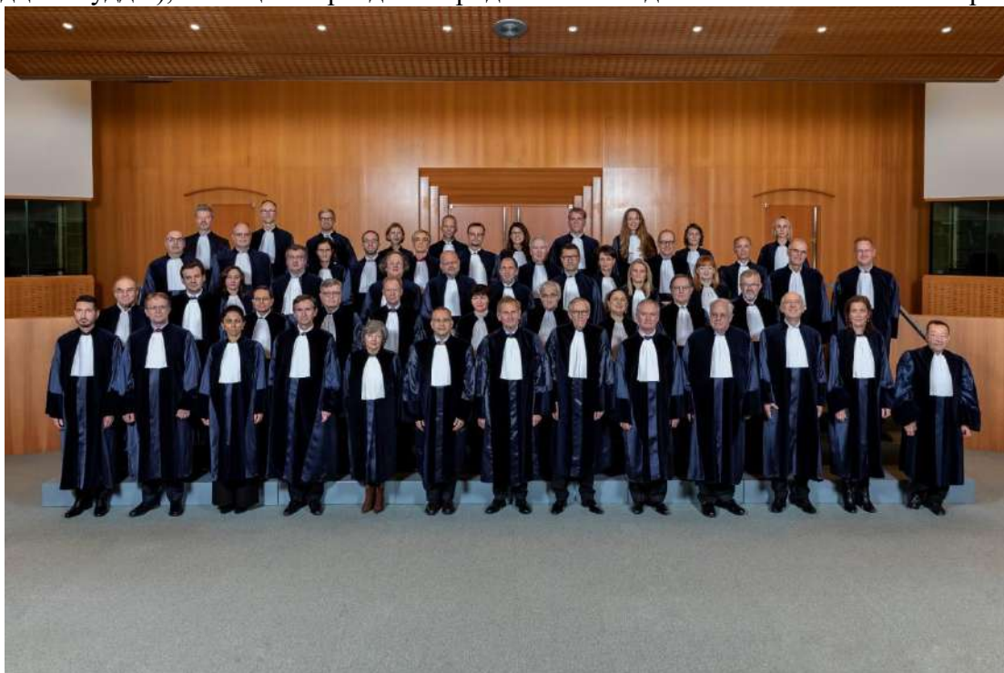
Суд загальної юрисдикції (General Court) 20.09.2019

Справи Судом загальної юрисдикції розглядаються палатами з п'яти-трьох суддів або, в деяких випадках, одним суддею. Він також може бути членом Великої палати (п'ятнадцять суддів), коли це виправдано юридичною складністю або важливістю справи.