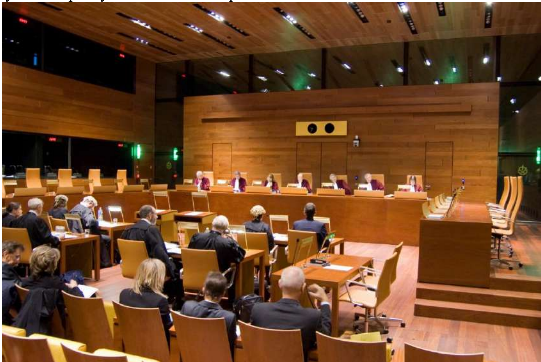
Слухання у Суді (Court of Justice)

2. Усна стадія - громадські слухання. Юристи обох сторін можуть передавати свою справу суддям та адвокатам, які можуть їх допитати. Якщо Суд вирішив, що висновок генерального адвоката необхідний, він надається через кілька тижнів після слухання. Потім судді обмірковують і виносять вирок.