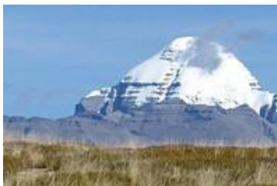
Рис. 2.4. Кайлас – священна гора Тибету