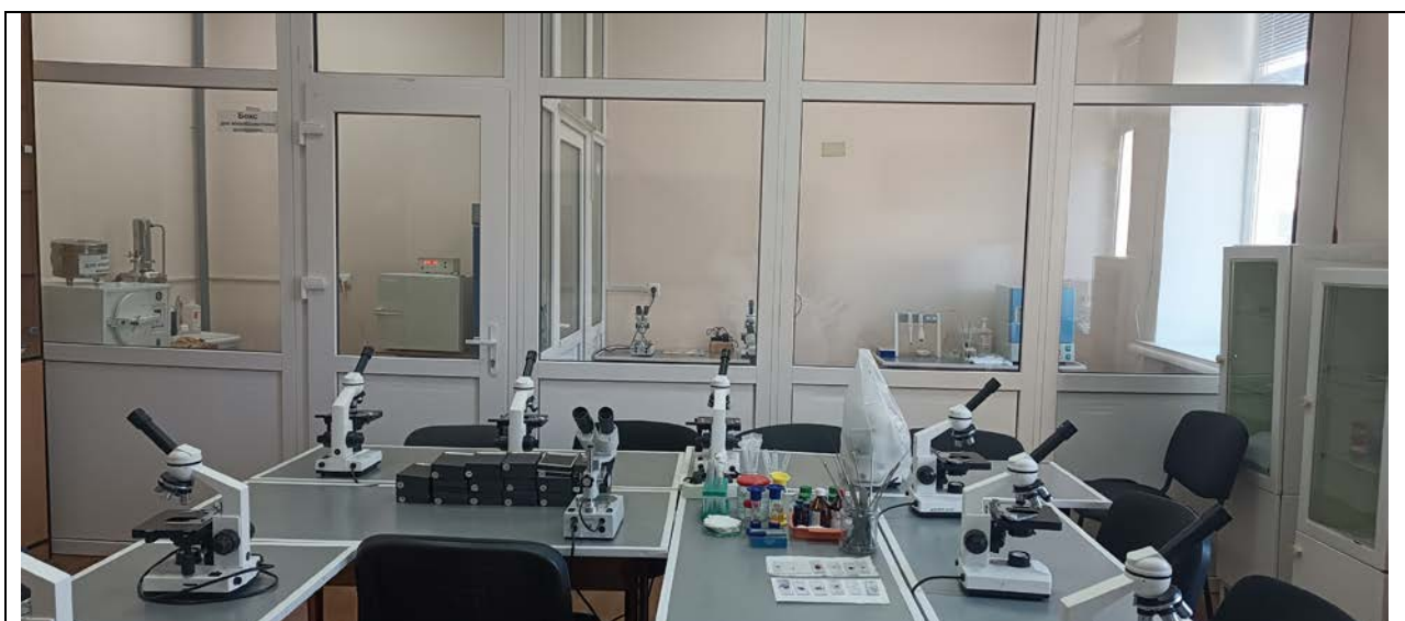
Бокс для наукових досліджень (каб. 4-201)