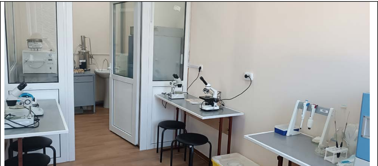
Внутрішнє обладнання боксу (4-201)