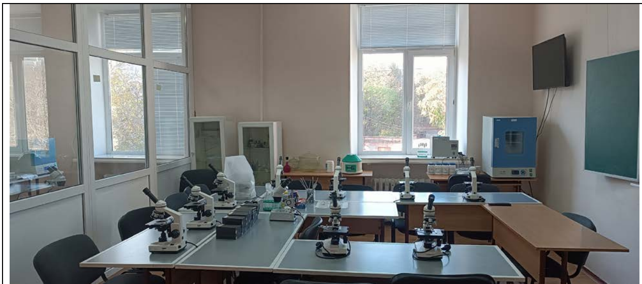
Лабораторна база гуртка – Навчально-наукова лабораторія мікробіології, вірусології та імунології (каб. 4-201)