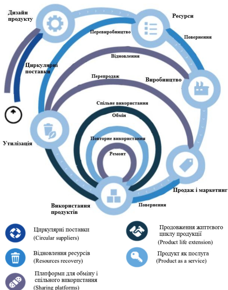
Рис. 2. Взаємозв'язок відомих циркулярних бізнес-моделей, які рекомендовано впроваджувати в Україні

суттєво дешевше і вигідніше, ніж їх створення із нуля. У результаті собівартість і ціна продажу знижуються, тим самим створюючи вигоду для споживача.