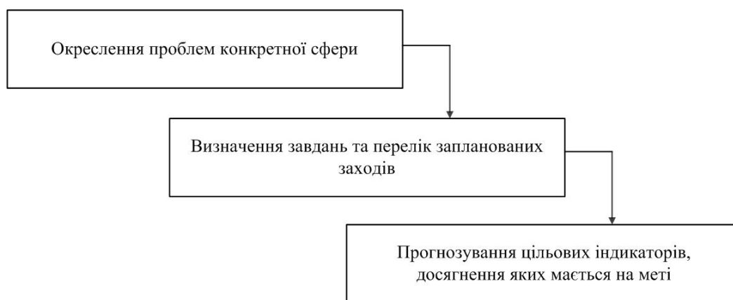
Рис. 2. Етапи планування досягнення стратегічних цілей розвитку

Варто також зазначити, що, відповідно до ст. 94 Бюджетного кодексу України, загальний обсяг фінансових ресурсів за кожним видом міжбюджетних трансфертів, що враховується під час визначення фінансових нормативів бюджетної забезпеченості, розраховується на підставі державних соціальних стандартів і нормативів, які встановлюються законом та іншими нормативно-правовими актами [1]. Проте державні соціальні стандарти та нормативи, які б мали бути основою для розрахунку наданих із державного бюджету трансфертів та в подальшому відобразитися у здійснених видатках місцевих бюджетів, у переважній більшості не затверджені. У зв'язку із цим в умовах дефіцитності бюджетних коштів обсяг видатків місцевих бюджетів на утримання бюджетних установ переважно галузей соціальної сфери залежить від фінансових можливостей державного та місцевих бюджетів (окрім цільових субвенцій, отриманих