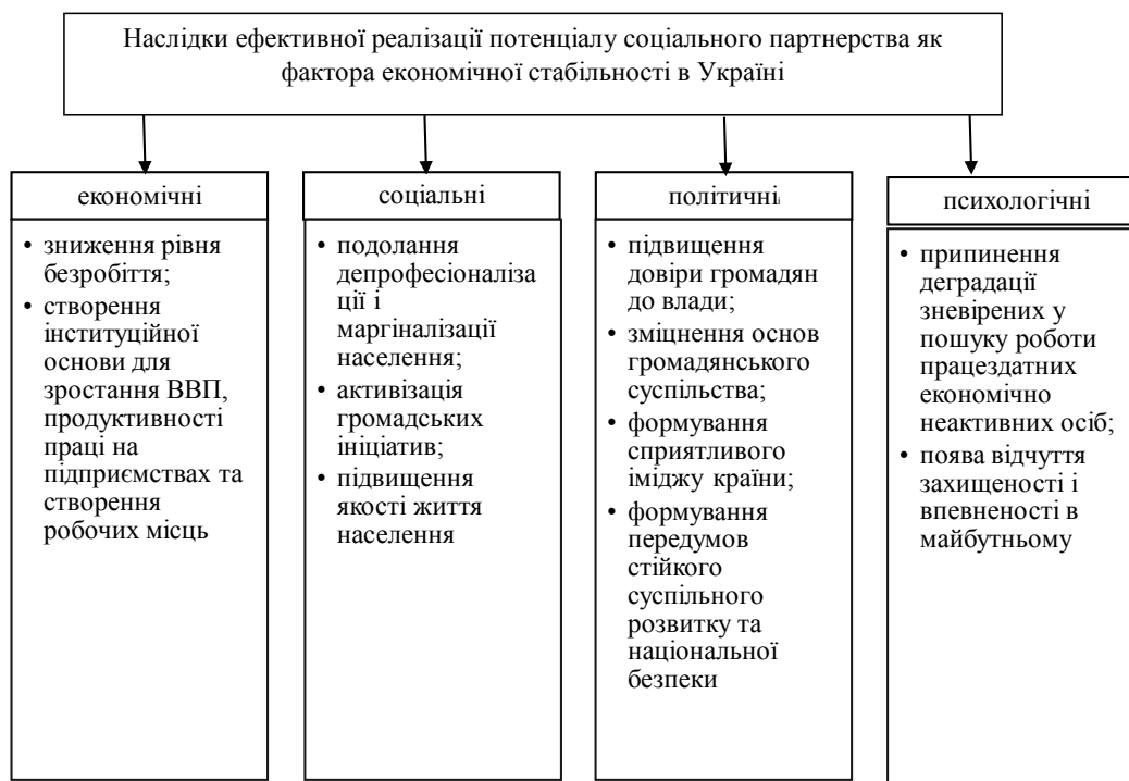
Рис. 2. Потенціал інституту соціального партнерства як фактора економічної стабільності в Україні