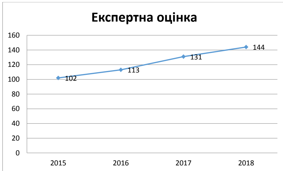
Рис. 2. Результати проведення анкетування для аналізу податкового аудиту на підприємстві