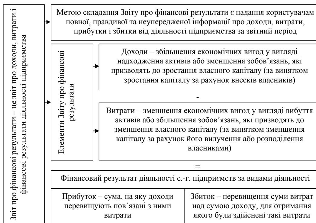
Рис. 1. Мета складання та елементи Звіту про фінансові результати

Крім традиційних математично-статистичних методів дослідження фінансових результатів, учені виокремлюють економічні методи, методи економічної кібернетики й оптимального програ-