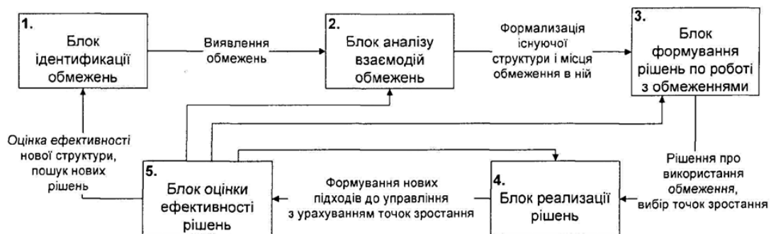
Рис. 2. Схема механізму вибору точок зростання