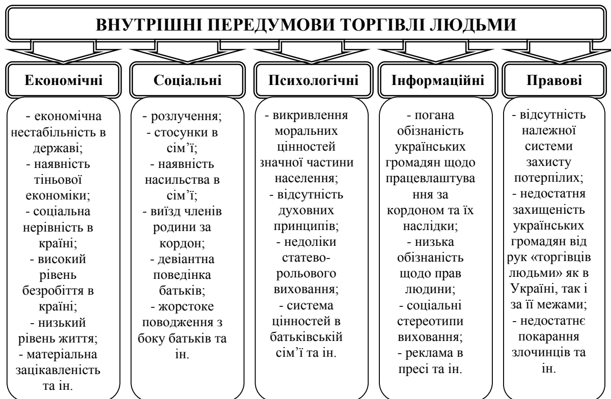
Рис. 2. Класифікація внутрішніх передумов торгівлі людьми

4. Пропозиція, наявність потенційних жертв (бідність та економічна нерівність між країнами та регіонами; обмеження пропозиції щодо працев-