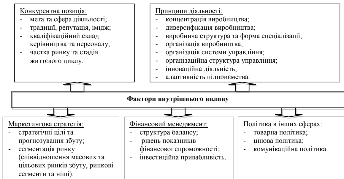
Рис. 3. Класифікація факторів внутрішнього впливу

У контексті розгляду діагностики як елемента системи управління підприємством під функцією фінансової діагностики пропонуємо розуміти вид спеціалізованої управлінської діяльності,