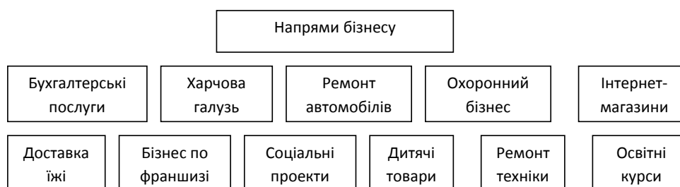
Рис. 3. Варіанти напрямів бізнесу в умовах економічної кризи

до фінансово-кредитних ресурсів, зокрема, шляхом надання часткової компенсації відсоткових ставок за кредитами, часткового відшкодування суб'єктам МСП лізингових.