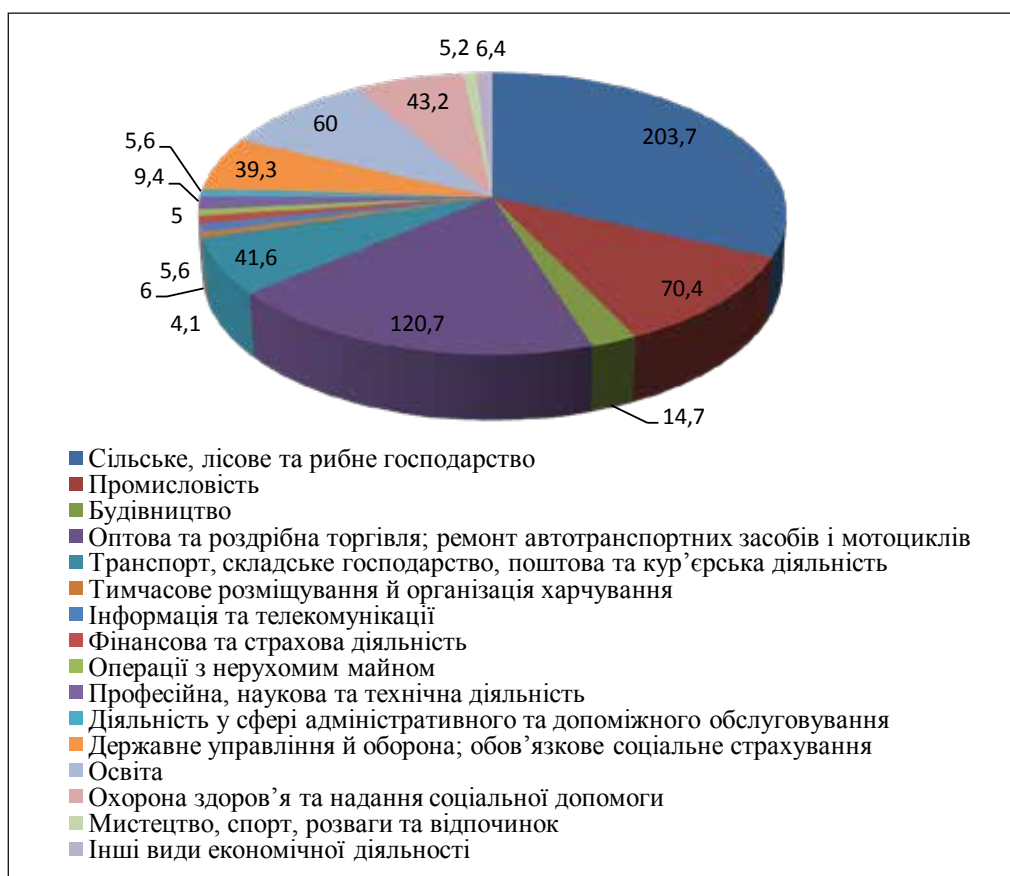
Рис. 2. Зайнятість населення за видами економічної діяльності у Вінницькій області у 2017 році (тис. осіб) [12]

збільшувався кількість безробітного населення у віці 15–70 років у міських поселеннях і у 2017 році становила 46,6 тис. осіб. Що стосується тенденцій розвитку регіонального ринку праці у сільській місцевості, тут також спостерігаються негативні тенденції, пов'язані з поступовим скороченням зайнятих у віці 15–70 років, а саме 307 тис. осіб у 2017 році, що на 6,7 тис. осіб (2,1%) менше, ніж в 2016 році, та на 14,3 тис. осіб (4,5%) та 19,4 тис. осіб (5,94%) порівняно з 2015 та 2014 рр. відповідно [11].