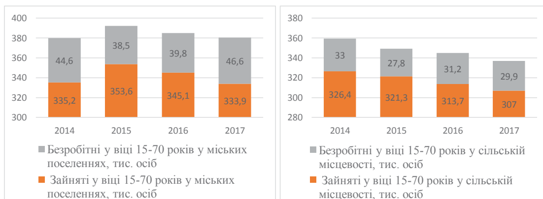
Рис. 1. Динаміка економічної активності сільського та міського населення у Вінницькій області у 2017 р. [11]