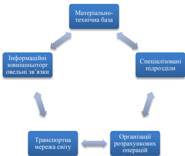
Рис. 1. Основні інфраструктурні елементи світової торгівлі

Сучасна зовнішньоторговельна структура та класифікація є сукупністю інститутів, які забезпечують швидкість пересування товарів та послуг від виробника до споживача. Основними інфраструктурними елементами світової торгівлі належать такі (рис. 1).