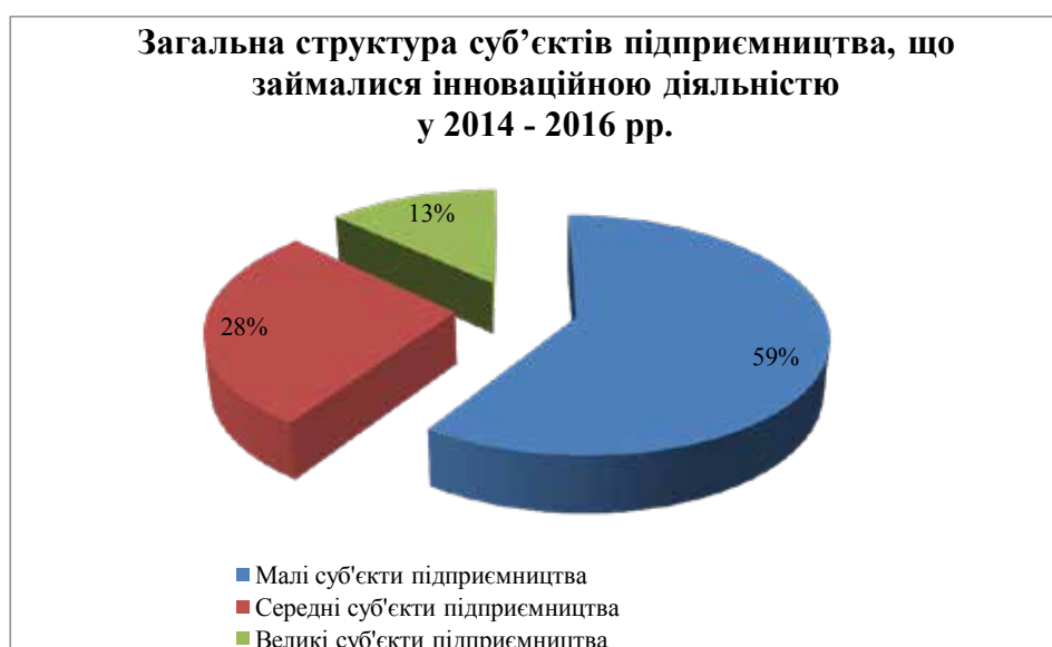
Рис. 1. Загальна структура суб'єктів підприємництва, що займалися інноваційною діяльністю у 2014–2016 рр.