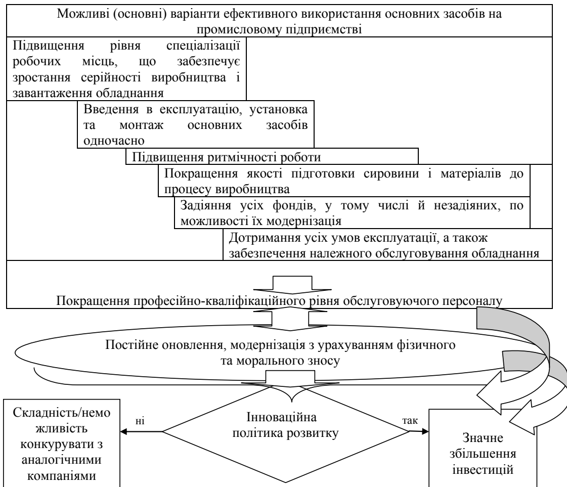
Рис. 3. Алгоритм основних варіантів ефективного використання основних засобів на промисловому підприємстві

Якісно-кількісна діагностика основних засобів підприємства з роками тільки ускладнюється.