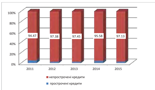
Рис. 2. Структура кредитів та заборгованості клієнтів ПАТ «Укрсиббанк»

Позитивним моментом є досить висока дисципліна позичальників. На кінець 2015 року частка прострочених кредитів становила лише 2,87% (рис. 2).