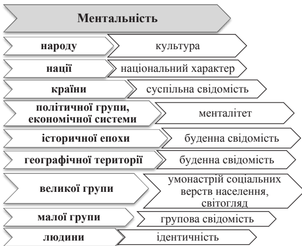
Рис. 3. Використання поняття «ментальність» на різних рівнях узагальнення (суб'єктно-діяльнісний підхід) [4, с. 15–16]

у термінах суб'єктно-діяльнісного підходу Брушлінського (рис. 3).