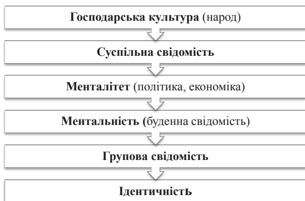
Рис. 1. Формування ментальності та культури [1, с. 232–233]

Діалектика матеріальних і духовних потреб досить складна. Вони формуються в тісному взаємозв'язку і взаємовизначають одне одного. Духовні потреби можуть випереджати матеріальні потреби. Соціальні потреби – це потреби особливого виду. У системі мотиваційних чинників, які формують моделі людської поведінки, соціальні потреби відіграють важливу роль. Соціальні потреби відображають необхідність у тих благах, які формують умови життєдіяльності не тільки людини, але і всього соціуму. Таким чином, носіями соціальних потреб є індивіди в межах конкретного суспільства (нації, страти, групи, покоління, сім'ї), які формують культурний простір.