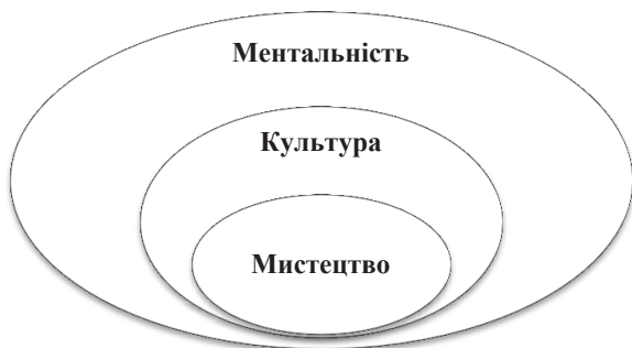
Рис. 4. Модель співвідношення понять «ментальність», «культура» і «мистецтво»

Ментальність складається зі складників групової свідомості, історичного часу і географічного простору. Якщо взяти до уваги позицію Флієра, який прирівняв культуру до історії, то за межами історії (але в межах ментальності) залишається істотна частина: групова свідомість людей, які проживають на одній території [5]. Це те, що «вони роблять самі» зі своєї історії – живуть за своїми загальними правилами, спілкуються, наділяють історію своїм сенсом, тобто створюють свою культуру. Таким чином, ментальність ширша за культуру, вона вбирає в себе культуру як найцінніше, що стає метою існування та розвитку суспільства.