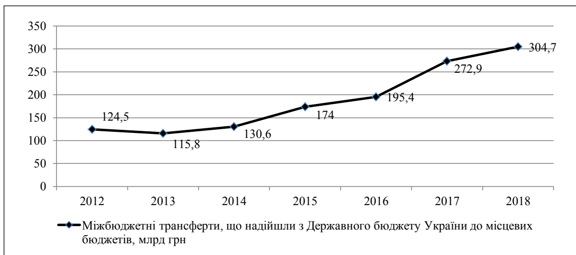
Рис. 2. Динаміка міжбюджетних трансфертів, що надійшли з державного бюджету України до місцевих бюджетів за 2012–2018 рр.