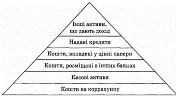
Рис. 2. Склад робочих активів банку [7]

До неробочих активів належать рахунки, що не приносять доходу банку. До їх складу входять: кошти в розрахунках; резерви; дебіторська заборгованість; кошти, вкладені у майно та господарські матеріали; видатки та збитки. Також ці активи мають малий термін обертання [7].