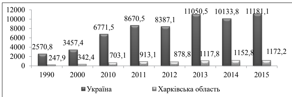
Рис. 1. Динаміка обсягів виробництва соняшнику в Україні і Харківській області за період 1990–2015 рр., тис. т

Ресурсний напрям відображає першочергову необхідність аналізу ефективності використання наявної матеріальної бази виробництва та живої праці. При цьому слід враховувати рівень завантаження обладнання в часі, структуру собівартості продукції, що виготовляється, з точки зору співвідношення в ній часток амортизації, матеріальних витрат, витрат на оплату праці. Зазначені показники слід розглядати в динаміці, а також за можливістю