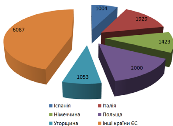
Рис. 3. Імпорт товарів в Україну з держав ЄС в 2016 р.