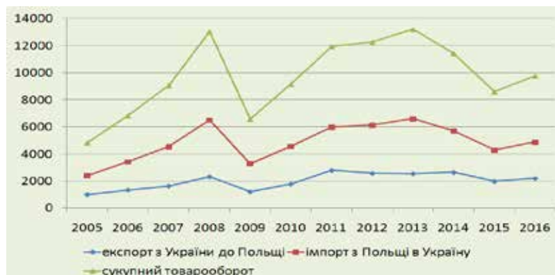
Рис. 1. Динаміка торгівлі товарами між Україною та Польщею у 2005–2016 рр., млн. дол.

За підсумками 2016 р. сукупний оборот торгівлі товарами між Україною та Польщею становив 4 893 млн. дол. з уже традиційним