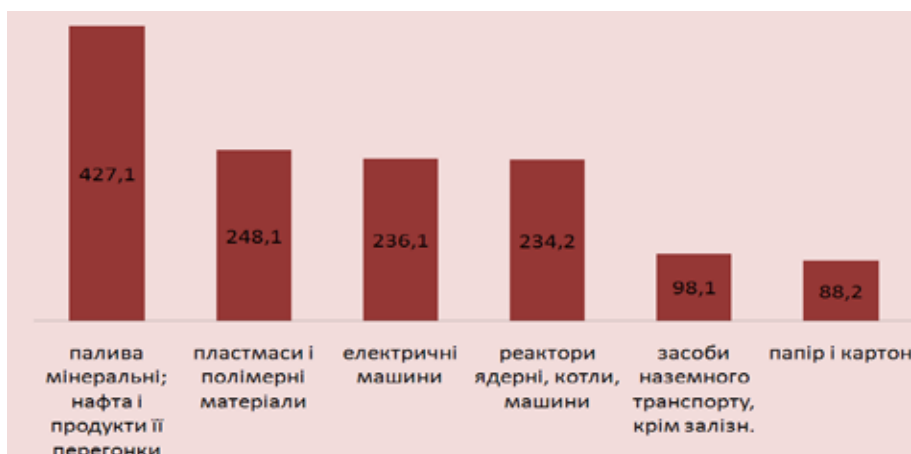
Рис. 5. Товарна структура польського імпорту в Україну в 2016 р., млн. дол.