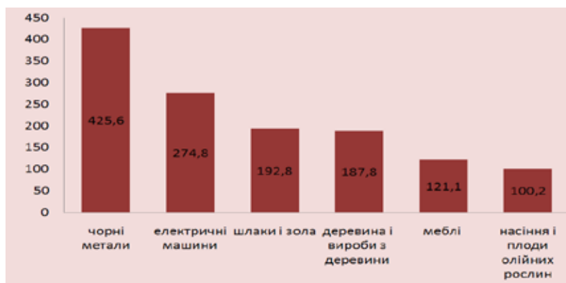
Рис. 4. Товарна структура українського експорту до Польщі в 2016 р., млн. дол.

Підводячи підсумки, маємо звернути увагу на ще один факт, спроможний відповісти на питання, наскільки важливе місце займає Польща у зовнішній торгівлі України та якою мірою обидві держави використовують наявний потенціал. Згідно з офіційною статистикою, впродовж аналізованого періоду український експорт до РП коливався у межах 2,3–5,8%, польський імпорт в Україну – в межах 2,2–7,1% (від сукупної вартості) [3]. І попри те, що впродовж кількох