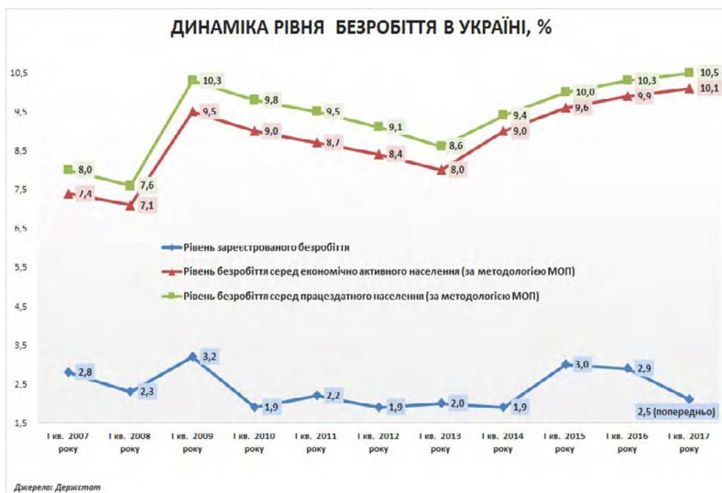
Рис. 1. Характеристика рівня безробіття в Україні [5]

У мінімальному розмірі допомога виплачується тим, хто за останній календарний рік має страховий стаж менше шести місяців або звільнений з останньої роботи з підстав, передбачених законодавством, а також переселенцям,