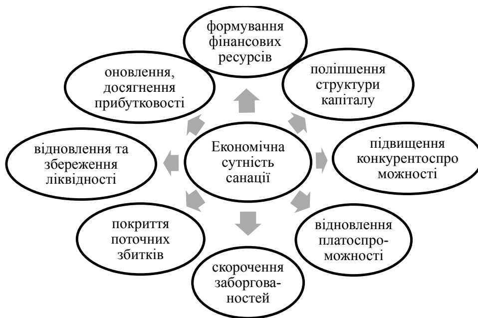
Рис. 2. Економічна сутність санації на підприємстві

Санація – комплексний процес, що передбачає удосконалення роботи всіх складових господарюючого суб'єкта для забезпечення ефективності його діяльності у довгостроковій перспективі, повинен постійно контролюватися та базуватися