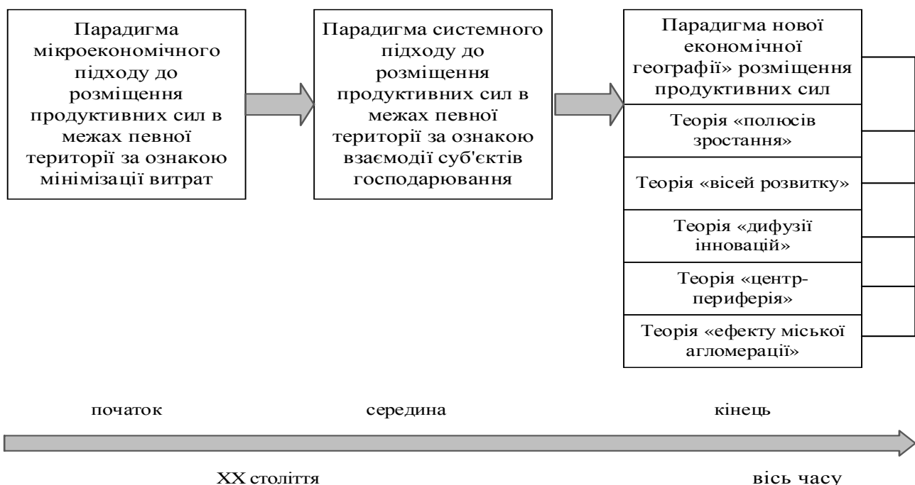
Рис. 1. Еволюція теорії просторового розвитку територій (регіонів)