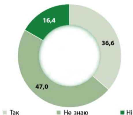
Рис. 1. Потреба в додаткових коштах, %

Експорт потребує значних капіталовкладень у виробництво, інфраструктуру, сертифікацію, маркетинг. Виконати всі умови можливо лише за наявності доступу до фінансових ресурсів та готовності банківського сектору працювати з компаніями плодоовочевого сектору.