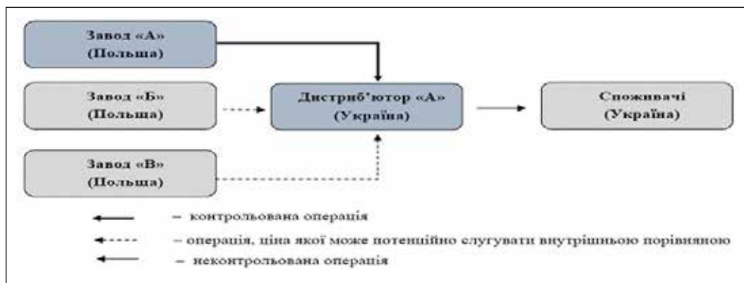
Рис. 3. Застосування внутрішньої порівняної ціни методу «витрати плюс»

Слід зазначити, що врахування переваг та недоліків кожного методу трансфертного ціноутворення дасть змогу компанії, що входить до міжнародної групи компаній, вибрати найбільш оптимальний метод для аналізу цін/показників рентабельності у контрольованій операції. Це дасть змогу уникнути матеріального та репутацій-