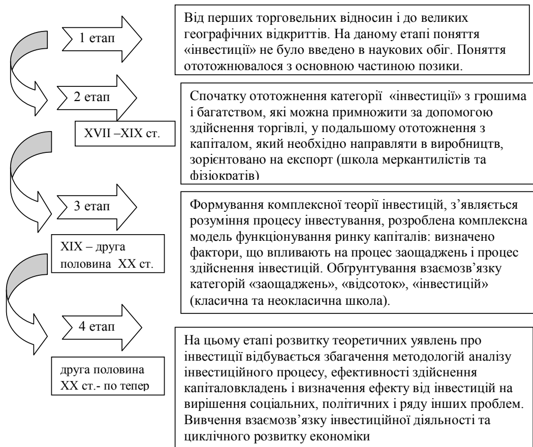
Рис. 1. Генезис поняття інвестиції

У господарській практиці, що пов'язана з інвестиційним процесом суб'єктів підприємни-