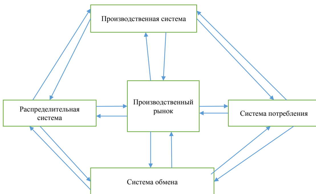
Рис. 1. Производственный рынок

Искажения данного элемента приводят к негативному влиянию на другие секторы экономики. На рис. 1 представлена схема производственного рынка.