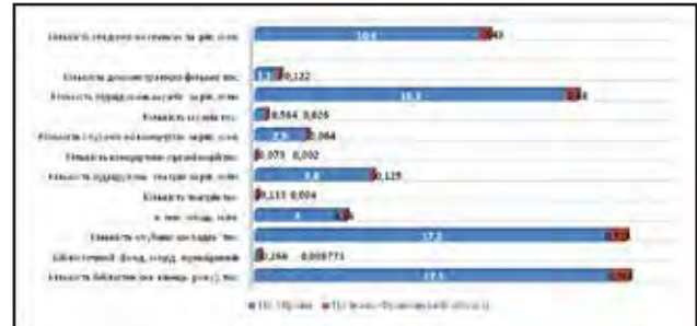
Рис. 2. Інфраструктура галузі культури і мистецтва Івано-Франківської області

дарств даного регіону є дещо нижчим порівняно з іншими розвиненими областями країни. Тому область доцільно віднести до потенційних регіонів, які здатні завдяки високому рівню розвитку інфраструктури зумовити процес росту культурно-мистецького комплексу, а також і споживання культурного продукту [8].