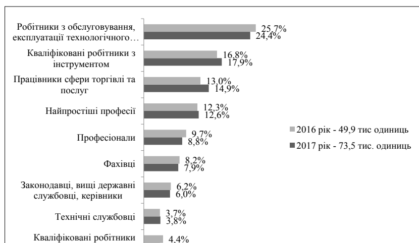
Рис. 3. Структура вакансій за професійними групами станом на 1 квітня 2016–2017 рр.,%

Станом на 1 квітня 2017 р. на одне вільне робоче місце претендувало шість безробітних (ста-