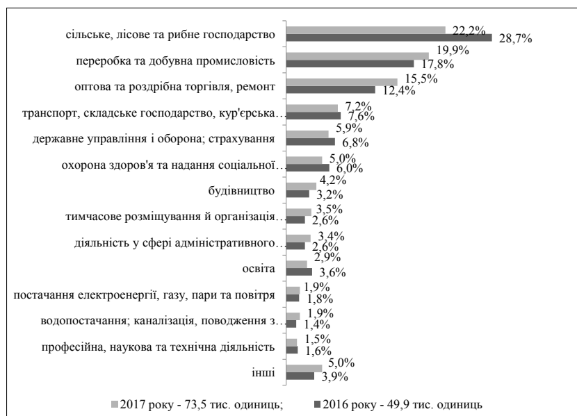
Рис. 4. Структура вакансій за видами економічної діяльності станом на 1 квітня 2016–2017 рр.,%