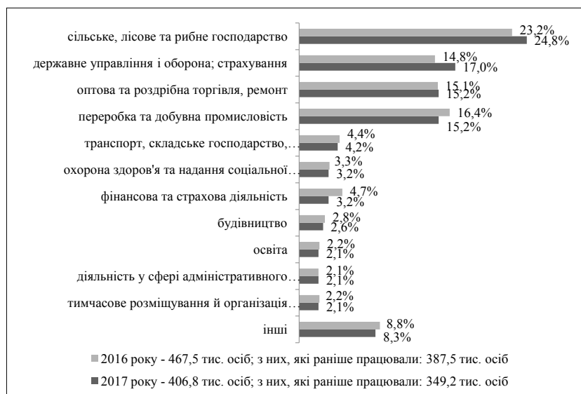
Рис. 2. Структура зареєстрованих безробітних за видами економічної діяльності станом на 1 квітня 2016–2017 рр.

Крім того, 59,2 тис. осіб залучено до громадських та інших робіт тимчасового характеру.