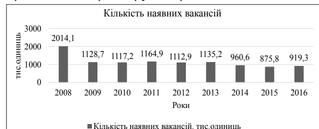
Рис. 1. Кількість наявних вакансій за 2010–2016 рр.

Порівняно з 2008 р. кількість наявних вакансій у 2016 р. скоротилася на 1 094,8 тис. одиниць. Дані стосуються вакантних місць за державним замовленням, вільні місця на підприємствах приватного характеру не враховано.