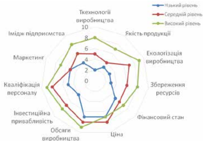
Рис. 2. Багатокутник конкурентоздатності аграрних підприємств за рівнем економічного потенціалу