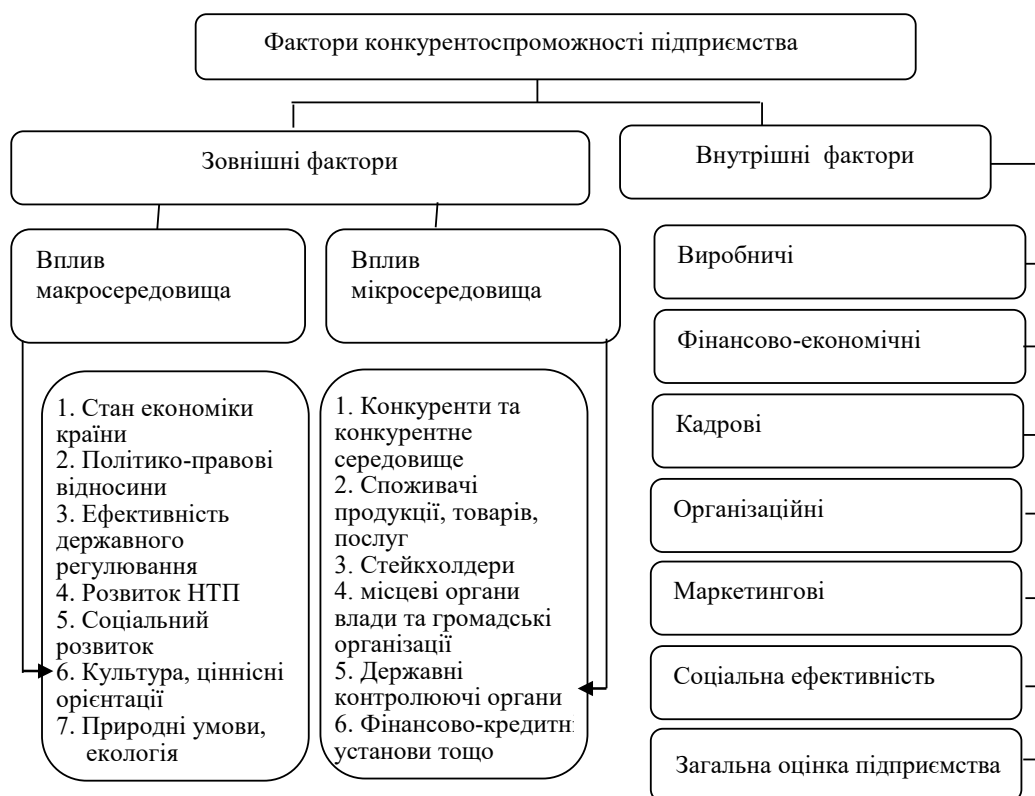
Рис. 1. Фактори формування конкурентоспроможності аграрних підприємства

Та, як бачимо з рис. 2, високий рівень потенціалу створює умови для інтенсифікації сільського господарства, що здійснюється на основі