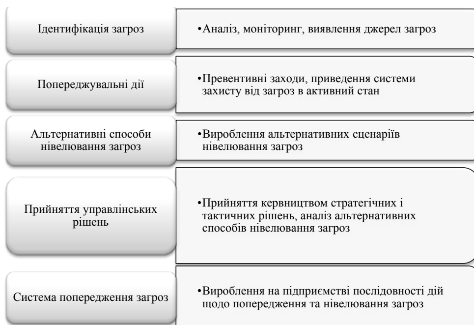
Рис. 2. Управлінський алгоритм нівелювання загроз економічній безпеці підприємств

1) небезпека – це об’єктивно наявний негативний вплив, який потенційно може дестабілізувати економічну безпеку підприємства, спричинивши негативні наслідки;