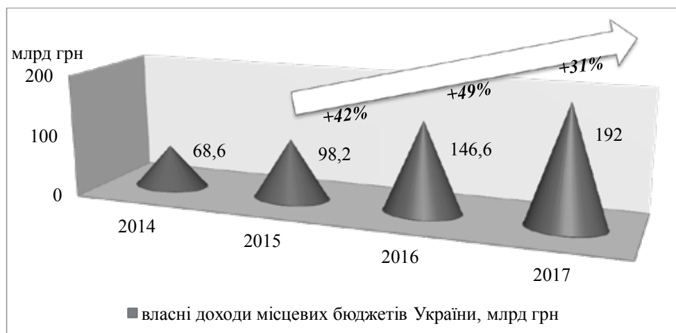
Рис. 3. Динаміка власних доходів місцевих бюджетів України за 2014–2017 рр., млрд. грн.