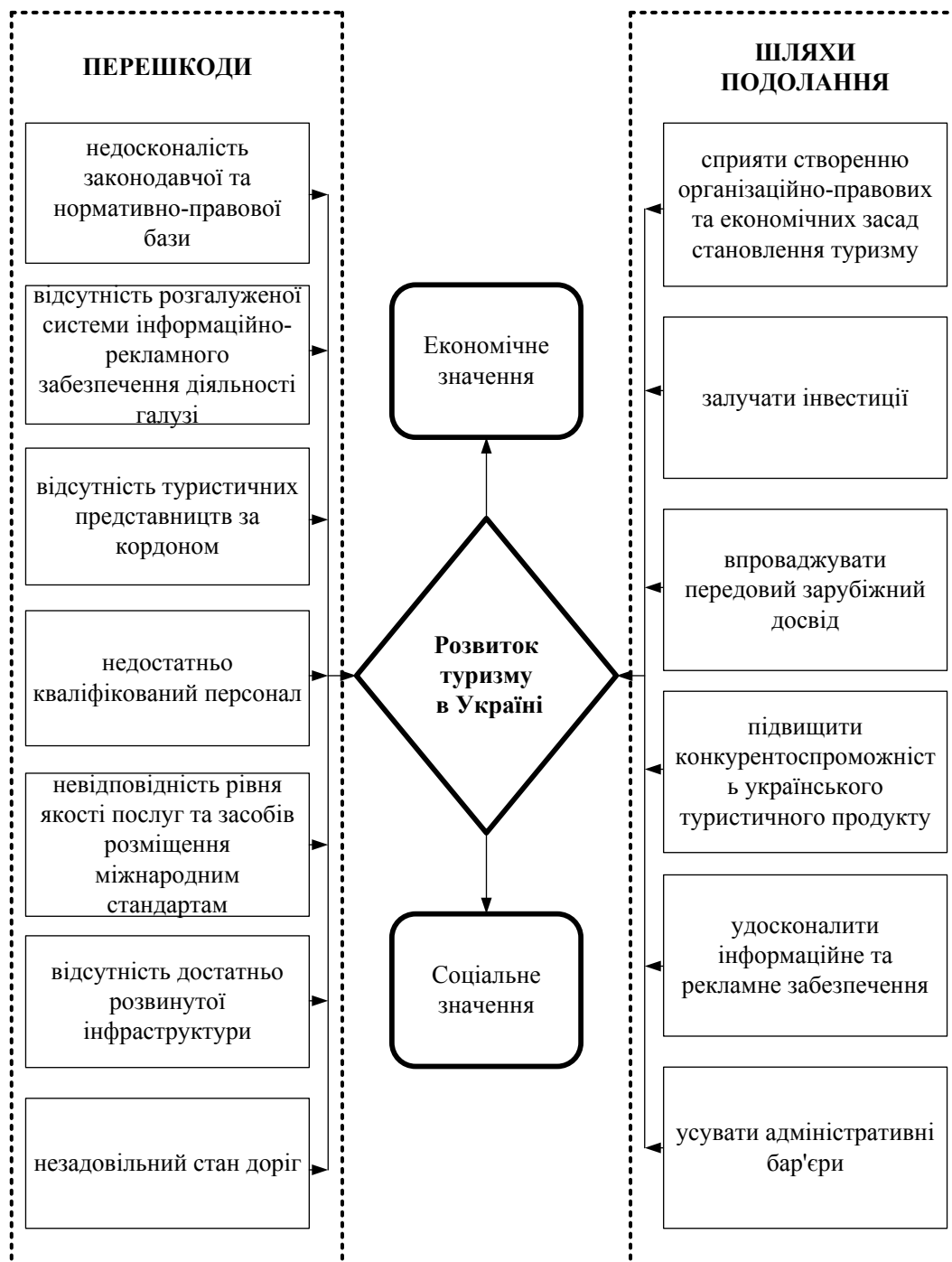
Рис. 3. Перешкоди розвитку туризму в Україні та шляхи їх подолання