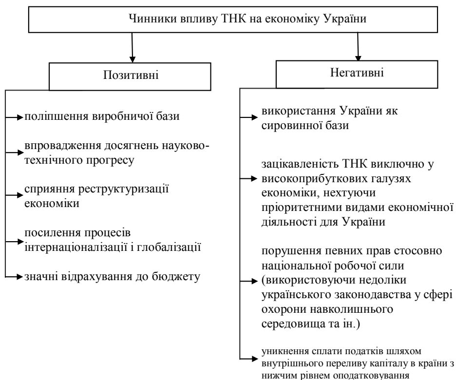
Рис. 2. Чинники впливу ТНК на економіку України