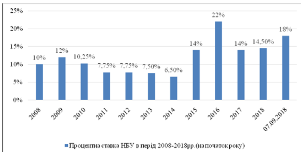
Рис. 1. Процентна ставка НБУ, 2008–2018 рр. (на початок року)

Підтримання ліквідності банку є серйозною та складною проблемою. У світовій практиці розроблено методи управління ліквідністю, які є складовою частиною всього банківського менеджменту. До складу таких методів входять: управління активами; управління пасивами; збалансоване управління ліквідністю (активами та пасивами) [10, с. 70]. Для зменшення ліквідності банків Нацбанк використовує свої депозитні сертифікати на двотижневий строк. Депозитний сертифікат – це борговий цінний папір, який було випущено банком для залучення коштів.