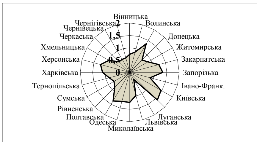
Рис. 3. Інтегральний показник туристської привабливості регіонів України

Саме на основі оцінювання туристичної привабливості регіонів країни державні органи можуть регулювати та визначати пріоритетні види туризму для селективного стимулювання розвитку регіонів, що сприятиме формуванню та просуванню туристичного продукту на національному та міжнародному ринках.