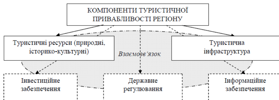
Рис. 1. Сукупність факторів, що визначають рівень туристичної привабливості регіону

1) екологічний, який визначає загальний екологічний стан, що склався у регіоні, та характеризується такими показниками, як наявність