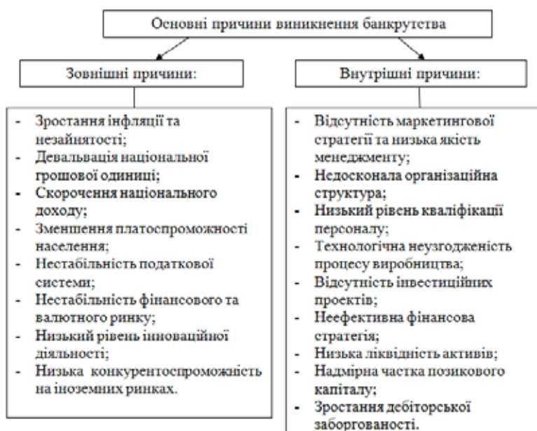
Рис. 1. Основні причини виникнення банкрутства