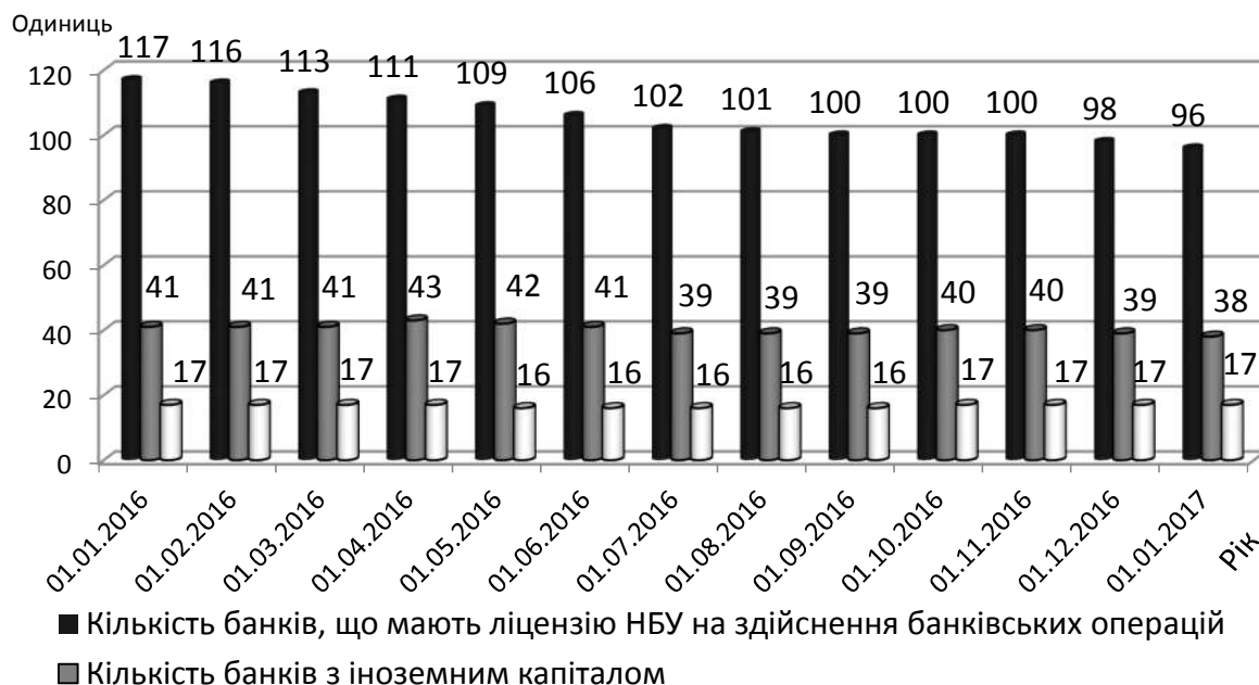
Рисунок 1 – Динаміка зміни кількості банків в Україні

Національного банку України здійснювати у сукупності такі операції: залучення у вклади грошових коштів фізичних та юридичних осіб та розміщення зазначених коштів від свого імені, на власних умовах та на власний ризик, відкриття та ведення банківських рахунків фізичних та юридичних осіб [1]. Таким чином, можемо зазначити, що основним завданням банку є здійснення посередництва в переміщенні коштів від кредиторів до позичальників. Банківська система – організаційна сукупність різних видів банків у їх взаємозв'язку, яка існує в тій чи іншій країні у відповідному періоді (рис. 1).