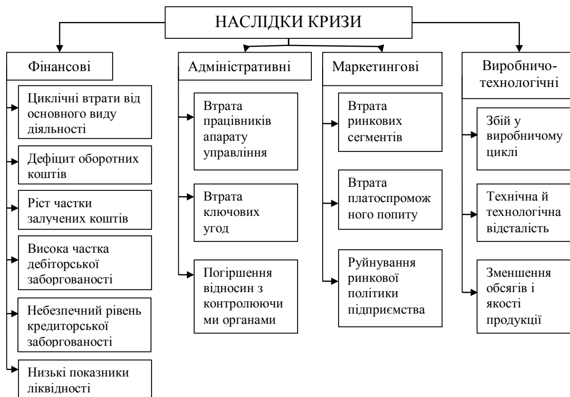
Рис. 3. Наслідки кризи для підприємства [4]

змогу виявити прогалини у висвітленні цієї теми. В результаті дослідження наукових джерел встановлено, що вчасне виявлення факторів та можливих наслідків кризи дає змогу глибше зрозуміти її сутність як процесу, закономірності та тенденції її розвитку, а отже, більш детально проаналізувати кризові ситуації, що виникають під час здійснення господарської діяльності підприємства, та розробити дієві механізми антикризового управління.